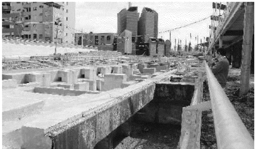
Una delle aree che verranno trasformate in parco entro i primi mesi del 2011

Intanto però è certo che almeno uno dei lotti, l'area Valdocco Nord, sulla sponda sinistra del fiume, non verrà realizzato in tempo per le celebrazioni: «Troppo laborio-