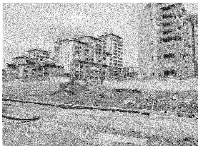
Lavori in corso davanti alle nuove case di Spina 3

so liberarlo dai cumuli di terra industriale inquinata che li vengono trattati e bonificati» hanno confermato lo scorso lunedì i tecnici del Comune durante un sopralluogo.