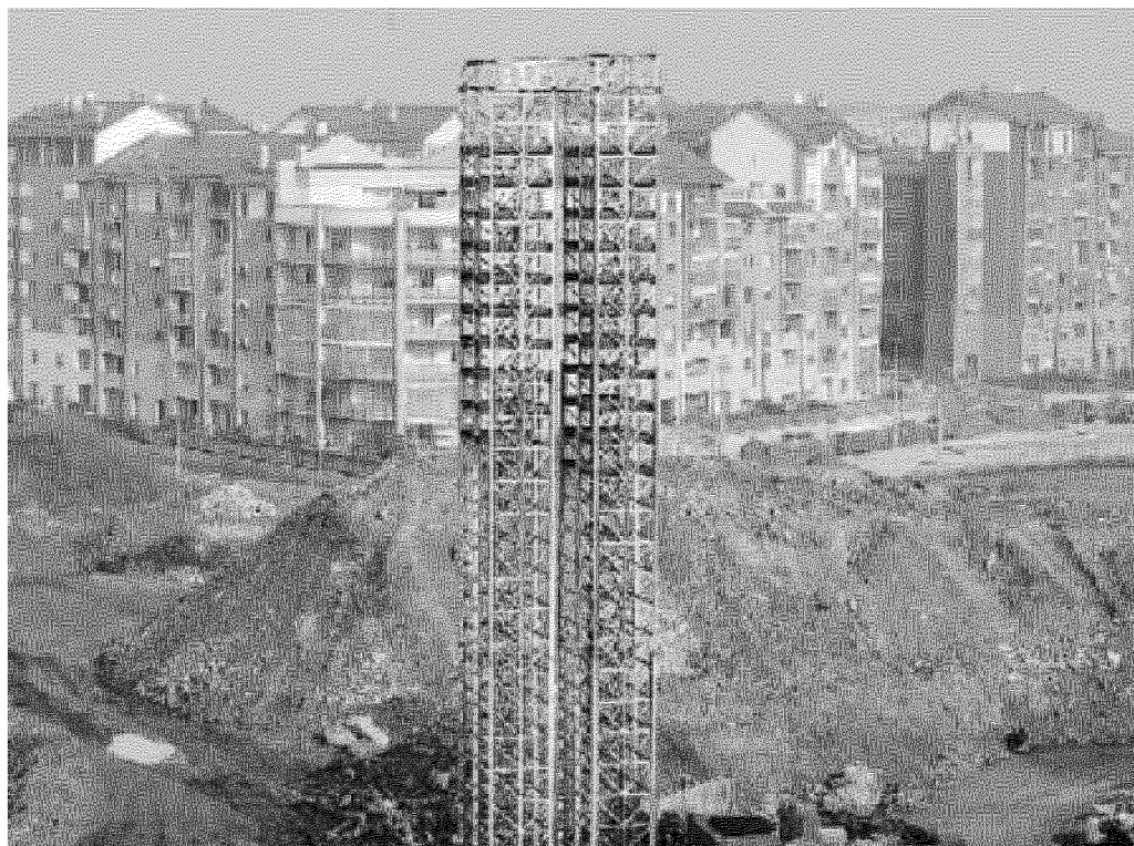
Una fase dei lavori attorno alle case della Spina 3

La petizione Oggi parte la raccolta firme: «Che ci diano almeno un centro culturale per i giovani del quartiere»