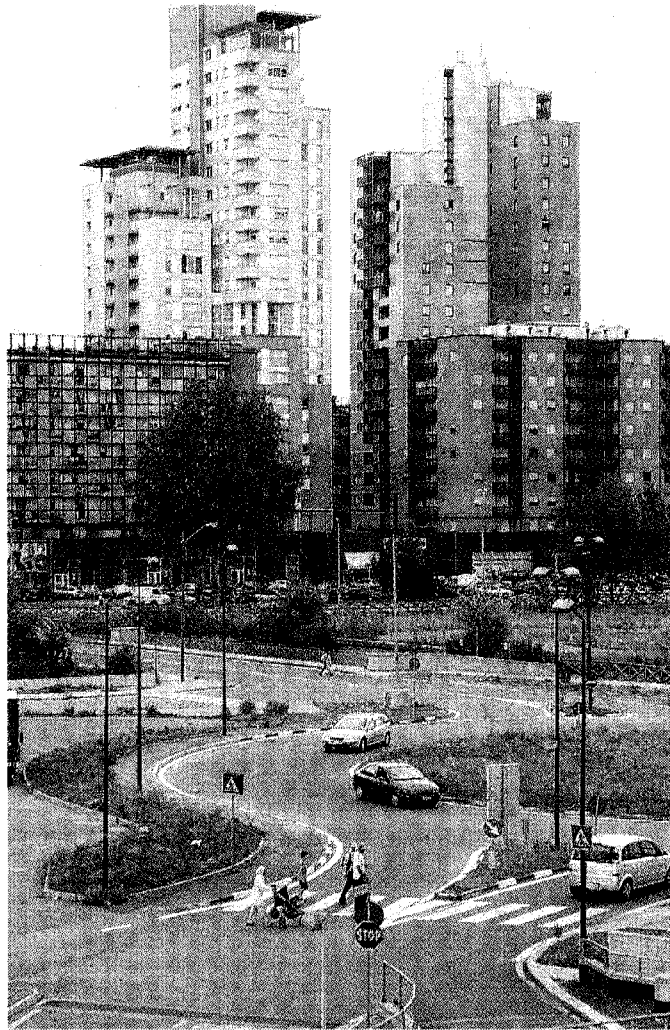
Una veduta del nuovo Parco Dora