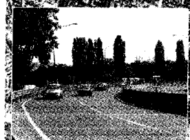
Curva delle Cento Lire sarà al centro della nuova strada che collegherà la superstrada di Chivasso allo scalo Vanchiglia