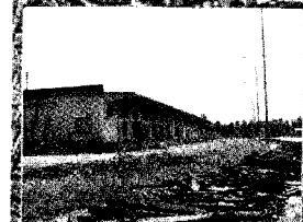
Scalo Vanchiglia è l'area sulla quale pubblico e privato realizzeranno nuovi insediamenti abitativi e commerciali